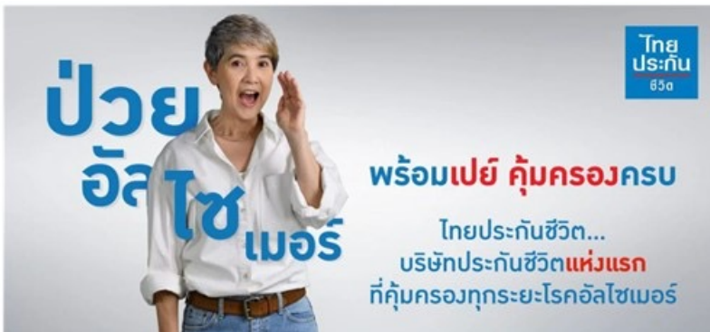
Prompt Pay108対象疾患の拡大を告知する広告