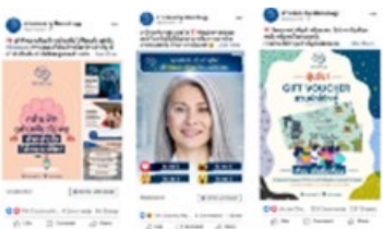
*疾患啓発を行うオンライン記事